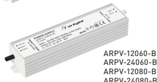
ARPV-12060-B ARPV-24060-B ARPV-12080-B ARPV-24080-B