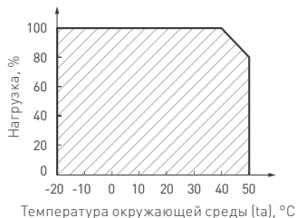
Рис. 2. Максимальная допустимая нагрузка, % от мощности источника.